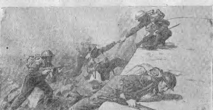
Atacando desde las bases aliadas en las islas británicas, las fuerzas de las Naciones Unidas tendrán una sombrilla protectora sobre sus cabezas... la R.A.F. (Real Fuerza Aérea)

El segundo frente debe abrirse en 1942, porque el año entrante caso de no ser vencido Hitler por sólo la URSS, estará en mejores condiciones para batirse a la desesperada